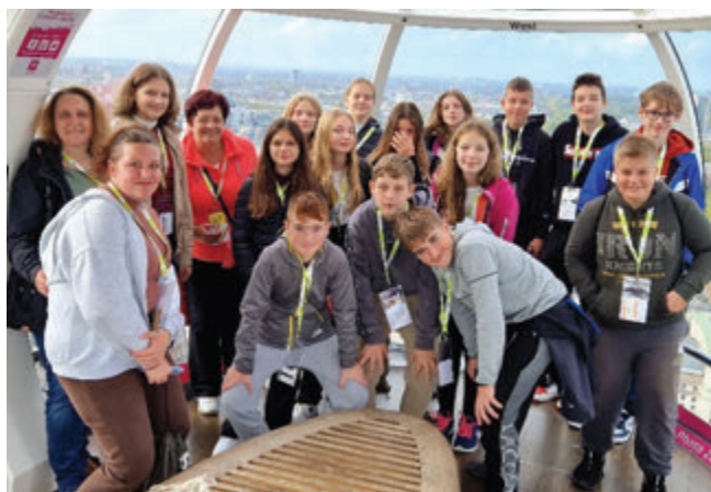
Na London Eye

naj povem, da je v resnici samo zvonu v zvoniku ime Big Ben, stolp pa se imenuje Elizabeth tower. Z njim v ozadju smo posneli toliko fotografij, da bi lahko ustvarili že skoraj samostojen album. Podrobneje smo si ogledali še dva muzeja, Natural History Museum in Science Museum. Četudi smo bili precej izmučeni, saj smo tudi ta dan prehodili veliko kilometrov, smo se okrepčali v Pizza Hut, nato pa se odpravili nazaj v hotel.