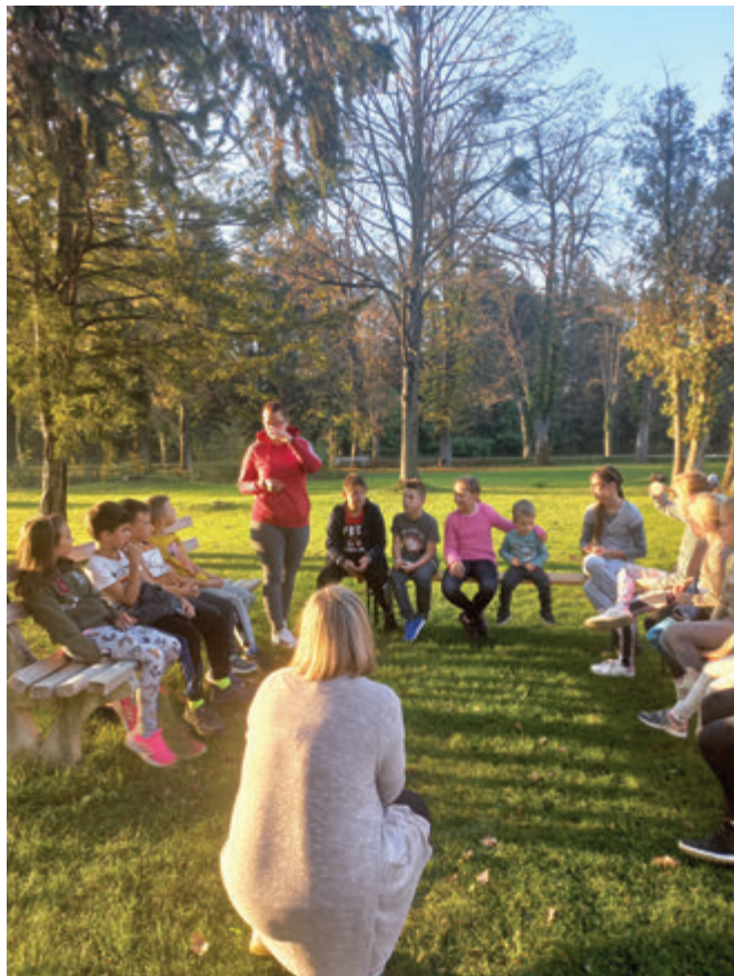
Turistični pomladek v parku

Do konca leta bomo izdali koledar za leto 2023. Pripravili božične jaslice pod grajsko kapelo, ki bodo odprte za ogled do konca januarja 2023. Z vlakom načrtujemo obisk prazničnega Celja na dan tepežnice. Pa morda še kaj, če ne bo prej zmanjkalo leta.