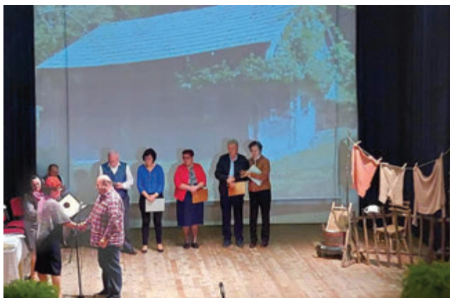
Pesem nas gor drži