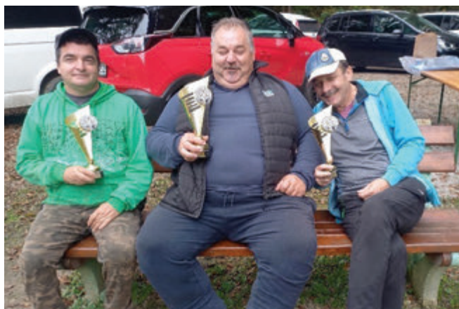
Prvi trije v sezoni