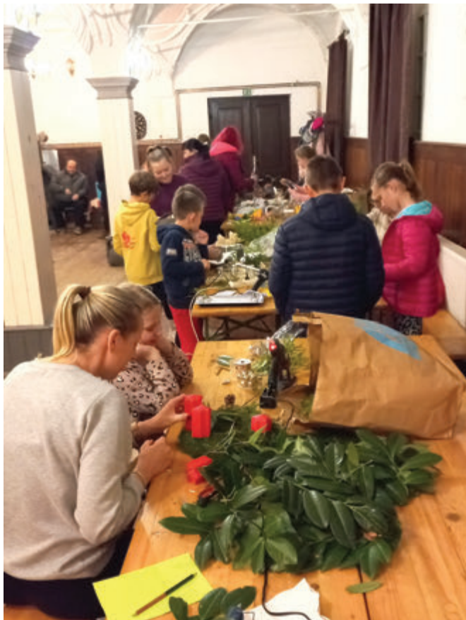
Delavnica Adventni venčki

tenberg, kjer smo se skupaj okrepcali s pravo štajersko kisló juho in domačo gibanico.