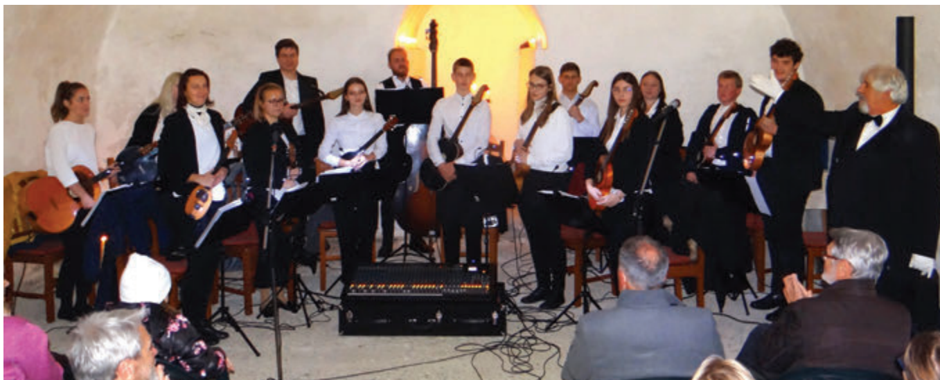
Tamburaški orkester KUD Majšperk