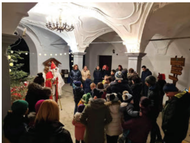
Miklavževanja na dvorcu Štatenberg