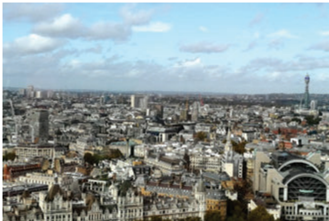
Pogled na London

Komaj smo se naspali, že je bil pred nami drugi dan potovanja, prav tako poln pričakovanj. Po obilnem angleškem zajtrku smo se odpravili na raziskovanje mesta. Ta dan smo doživeli tisti tipičen, zanimiv in znan London, kot ga poznamo s fotografij. Po mestu nas je popeljal domačin, naravni govorec in Anglež, Mr. Nick, ki se je z nami pogovarjal le v angleškem jeziku. Ogledali smo si menjavo straže pred Buckinghamsko palačo. Naj povem, da je gneča v resnici še večja, kot je to videti na fotografijah. Po tem, skoraj svečanem dogodku, smo se odpravili v narodno galerijo National Gallery, kjer smo videli vse vrste umetnin, tudi znamenite Van Goghove sončnice. Pot smo nadaljevali v kitajsko četrt China town, kjer smo občudovali prelepe laterne, ki so visele nad nami. V tem času je namreč potekal festival lune. Kakšno pa bi bilo naše potovanje v London, brez da bi si ogledali znameniti Big Ben? Seveda smo si ga ogledali, in sicer skupaj z britanskim parlamentom. Kot zanimivost