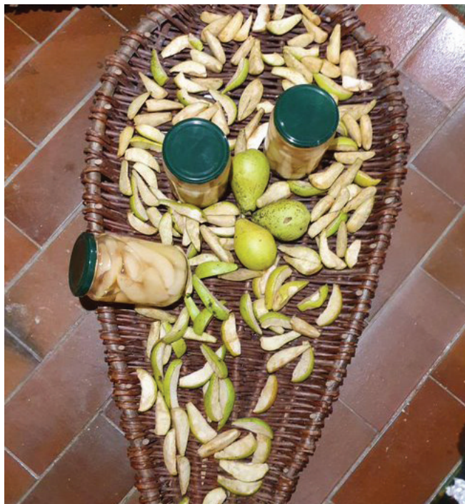
Hruške pastorovke (pastorjevke), pripravljene za sušenje in vložene