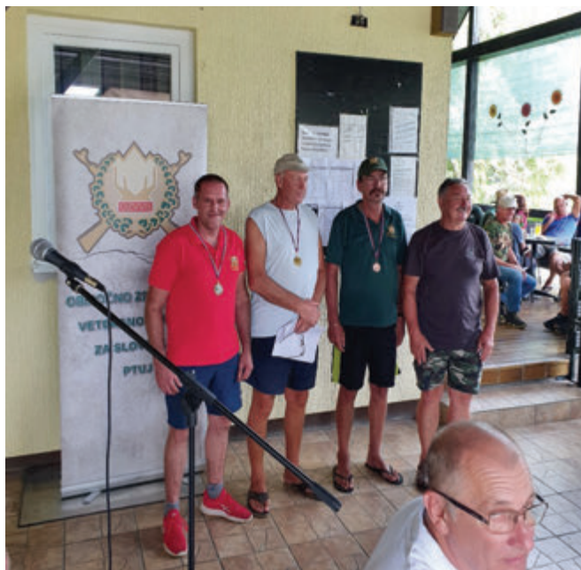
Med posamezniki drugi...