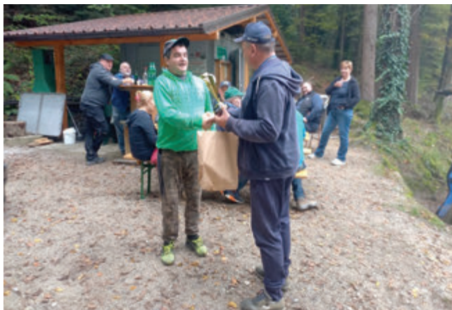
Vodja protokola Minč