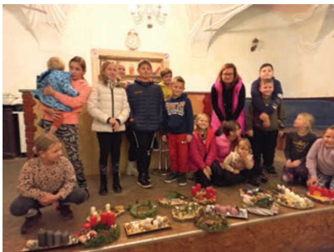
izdelki na ogled

Tako se leto že nagiba proti koncu. In december je tu. Za najmlajše smo 5. decembra pripravili miklavževanje na dvorcu Štatenberg. Za obdaritev otrok so poskrbeli starši. Za ta pravega Miklavža in njegovo spremstvo smo poskrbeli v društvu. Prav tako smo po programu in obdaritvi za vse prisotne pripravili skromno pogostitev. Prijetno smo se družili ob čaju in kuhanem vinu, obujali spomine na pretekle dogodke in tkali načrte za leto, ki je pred nami.