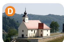
Pokopališka kapela sv. Lenarta (16. stoletje)