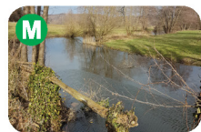
Rečišče Makole, 0,2 ha, globina 2,55 m