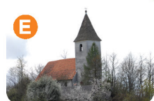
Cerkev sv. Ane (okrog leta 1300)