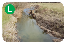
Reka Ložnica, izvira na Pohorju, 30 km