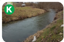
Reka Dravinja, izvira pod Roglo, 73 km

V Makolah so že v 19. stoletju kopali rjavi premog v rudniku Šega. Leta 1953 so ga ponovno odprli kot Rudnik črnega premoga (čeprav je bil rjav), a so ga 1963 zaprli zaradi poplavljanja. Leta 2014 so prizadevni člani TD Makole ponovno odprli vhod v rudnik.