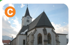
Župnijska cerkev sv. Andreja (okrog 1375)